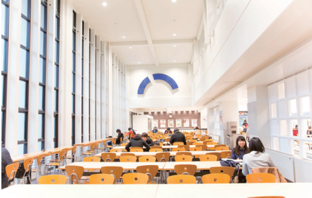
広々とした第一学生食堂

食堂が存在する。1階にあるのは4店舗が集まる第一学生食堂。うどん、ラーメン、鉄板料理、定食類を提供している。2階には4月より新たにオープンする出来たて中華の「桃李」、3階には井ぶり専門店「TORIKO」が店を構える。各食堂を回り、自分好みの店を見つけてみてはどうだろうか。（勝見季紘）